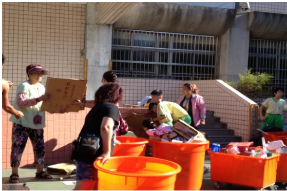
圖11 例行資源回收活動-資源再利用