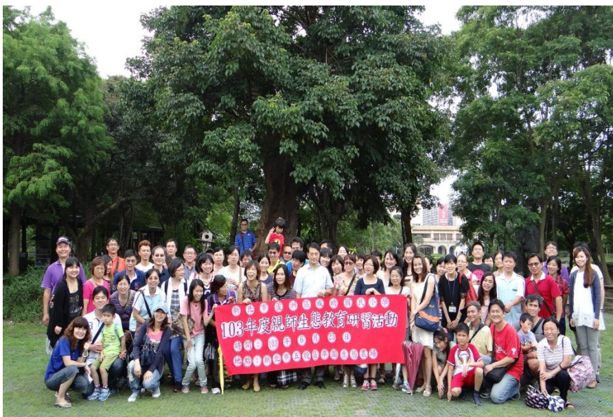
圖9 親師生準園生態農場教育研習-師生與農場環境互動