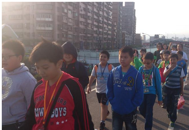
圖 4 蘆堤親水公園健走活動-學生社區環境踏查