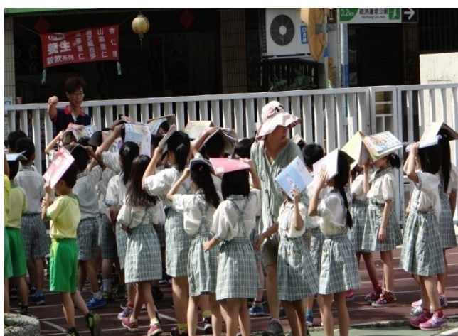
圖 7 複合式防災演練-學生疏散