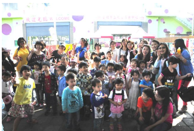
圖 5 兒童樂園-了解地方環境歷史