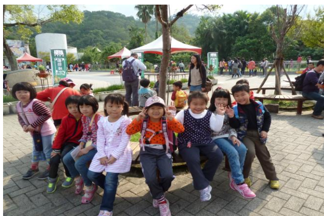
圖 6 木柵動物園-學習生物、生態與環境關係