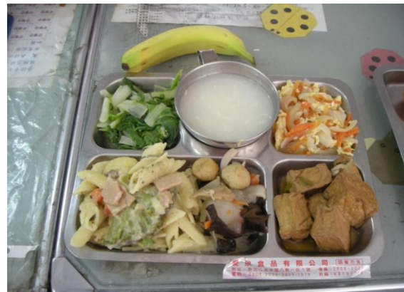
圖14 蔬食環保餐-減碳愛地球