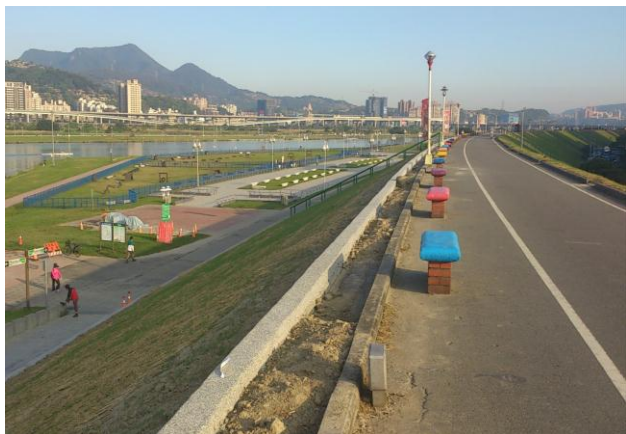
圖 3 蘆堤親水公園的優美環境