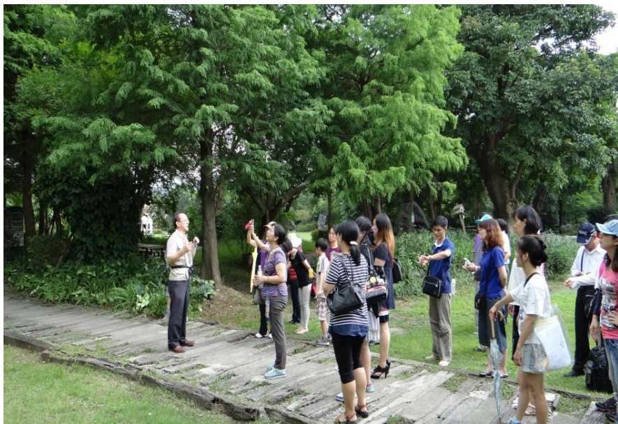
圖10 親師生準園生態農場參訪-生態環境踏查