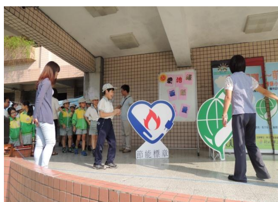
圖16 做個環保小尖兵-學生認識省水標章