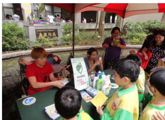
圖17 綠色消費-宣導園遊會