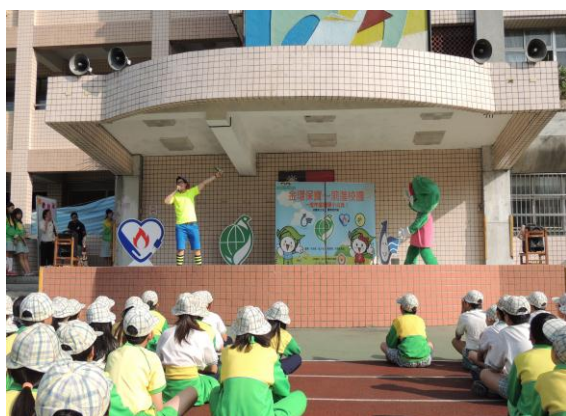
圖15 做個環保小尖兵-宣導活動