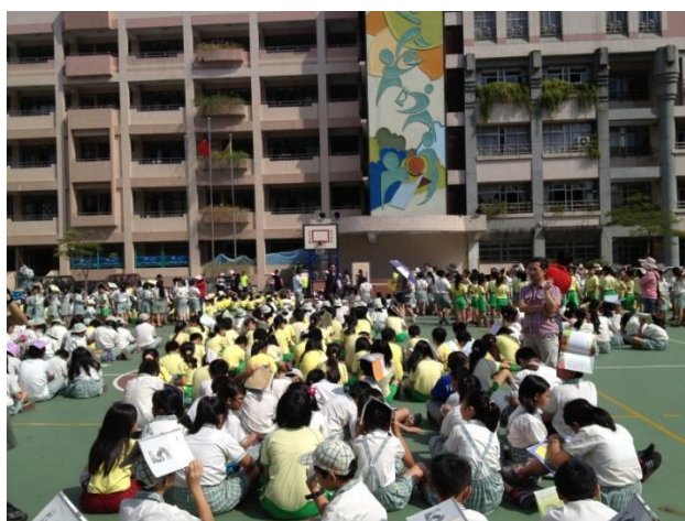
圖 8 複合式防災演練-學生操場集結