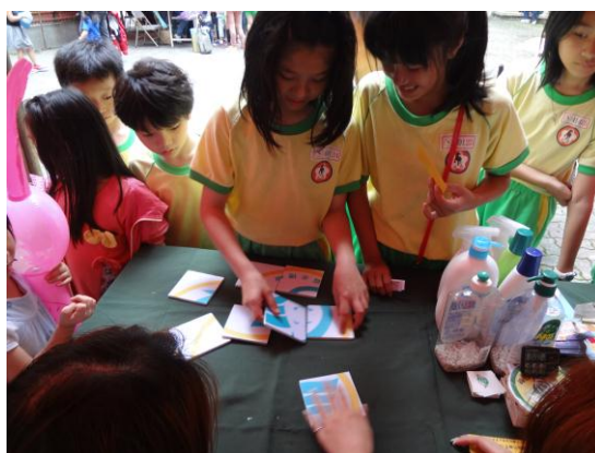
圖18 綠色消費-學生趣味活動