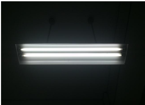
圖13 省電型燈管-減少能源消耗