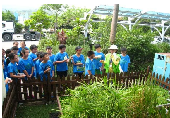
圖18 環保小尖兵參觀