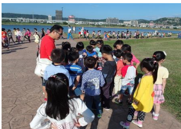
圖17 社區蘆堤健走-認識濕地動植物