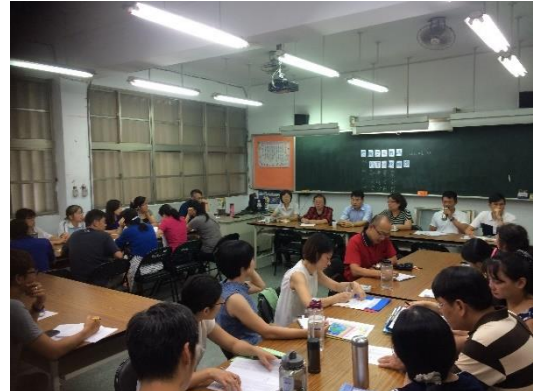
圖6 籌組環保小組，依計畫落實執行