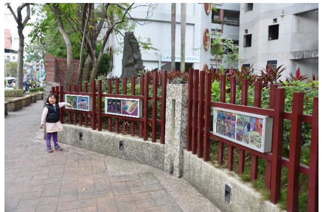
圖 10 教學環境-環境教育學藝競賽作品親善步道