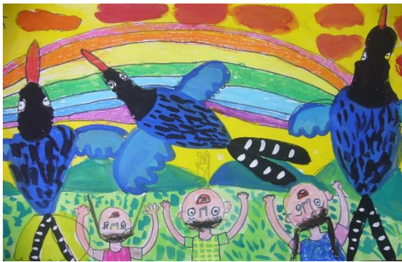
圖13環境教育每月徵畫活動