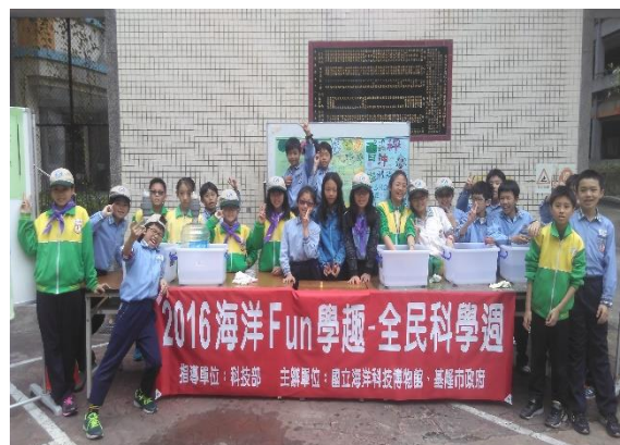
圖20海科館海洋小天使培訓與闖關活動