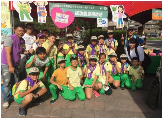
15 環保社團-同幼社協助跳蚤市場義賣活動