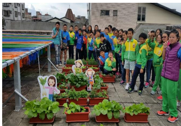
圖19台灣有機食農教育推廣協會食農工作坊