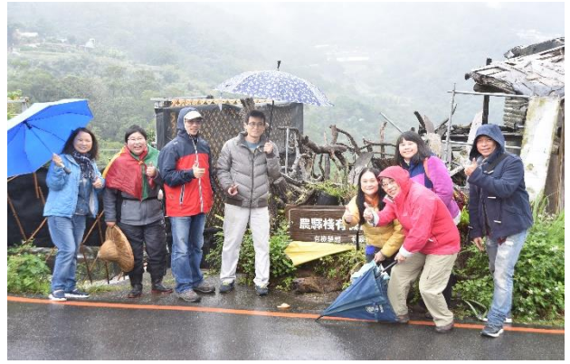
圖 8 環境教育學習社群-成功與環境的對話