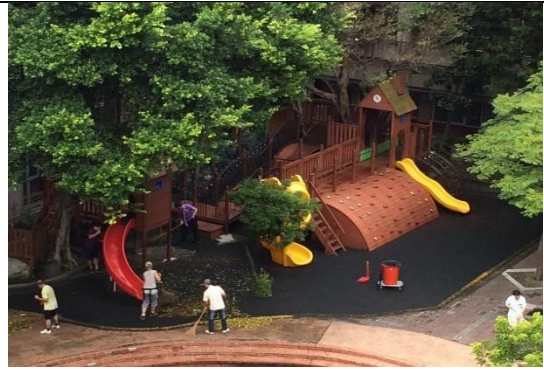
圖2紳士協會環保志工 - 協助校園綠化