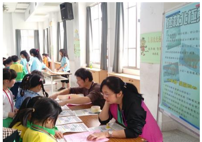
圖 12 搶救北極熊-節能減碳宣導