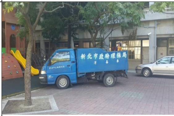
圖4 登革熱防治-校園消毒