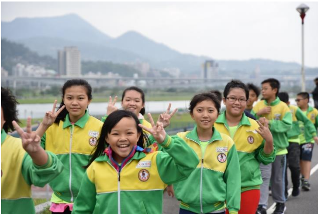
圖 9 蘆堤親水公園健走活動-學生社區環境踏查