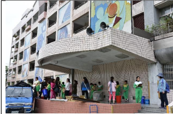
圖1學校環保志工隊-協助資源回收