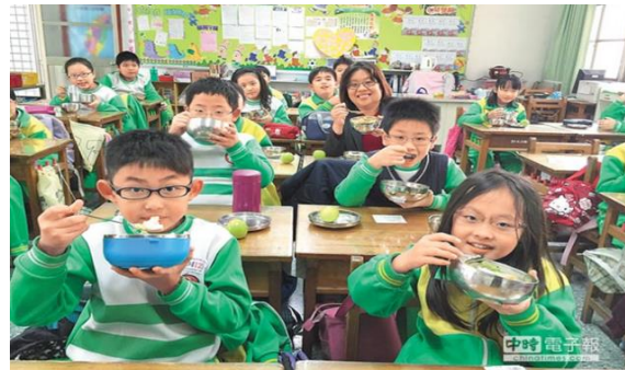
圖16 蔬食環保日-減碳愛地球