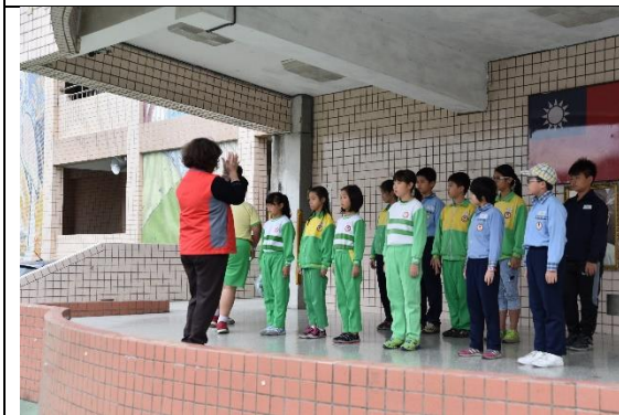
圖3 生活教育整潔競賽-落實整潔工作