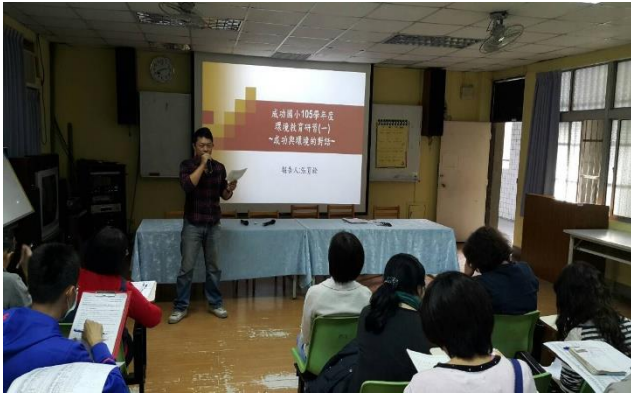
圖 7 環教教師研習- 蜜蜂搜查隊系列活動