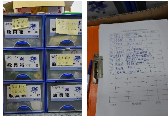
圖14 資源再利用- 捐贈校服運動服