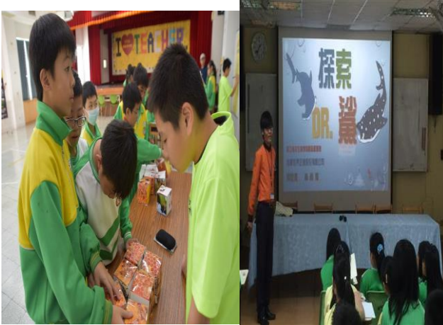
圖 11 生物保育:蜜蜂搜查隊闖關活動 探索DR.鯊宣導