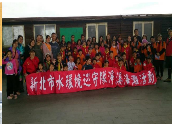
圖16 水環境巡守隊-童軍團拜訪與淨灘