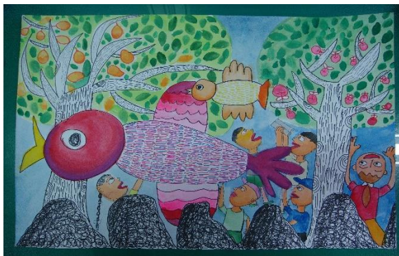
圖11 環境教育每月徵畫活動