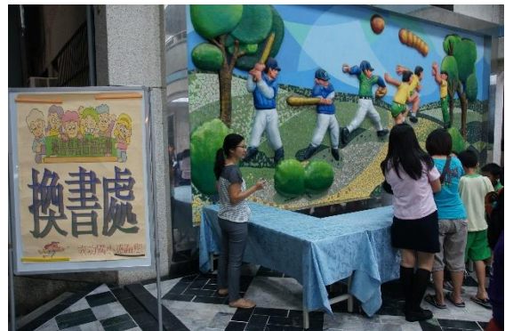
圖12 資源再利用-好書交換活動