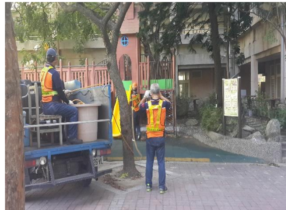
圖4 登革熱防治-校園消毒