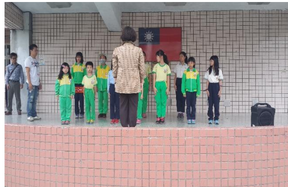
圖2 生活教育整潔競賽-落實整潔工作