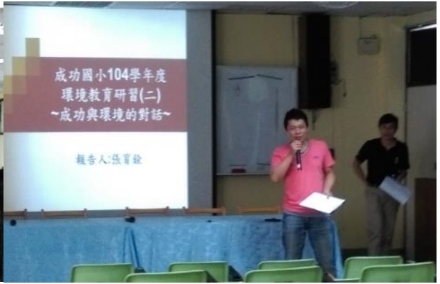
圖 5 環教教師研習-台灣所面臨的真相(李鴻源教授) 圖 6 環境教育學習社群-成功與環境的對話