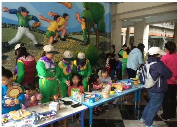
圖13 環保社團-同幼社協助跳蚤市場義賣活動