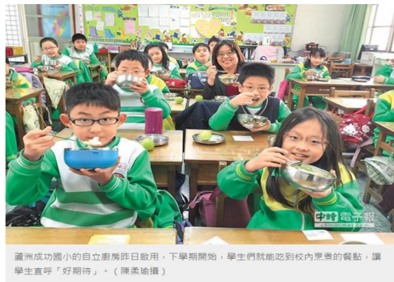
圖14 蔬食環保日-減碳愛地球