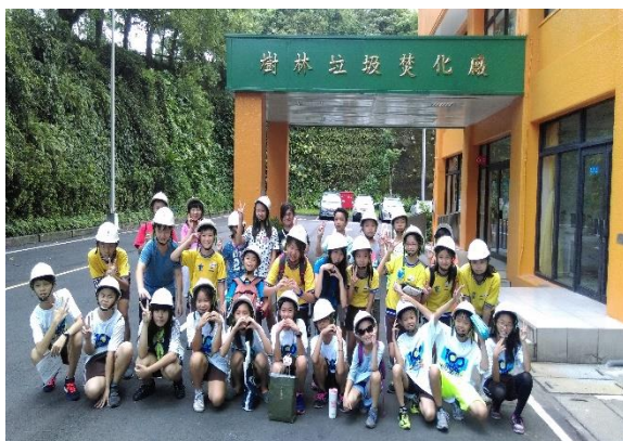
圖15 環保小尖兵-參觀焚化爐