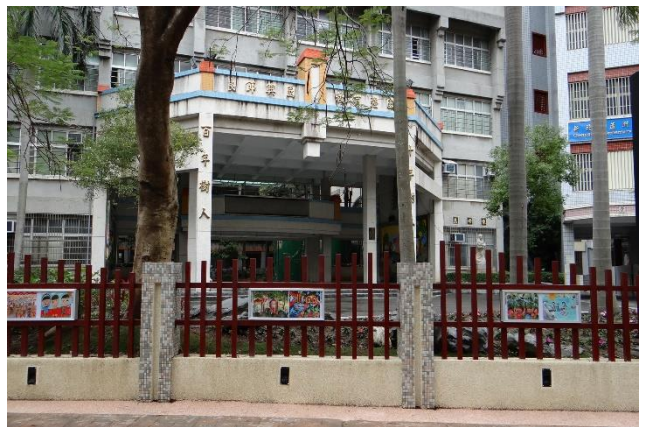
圖 7 蘆堤親水公園健走活動-學生社區環境踏查 圖 8 教學環境-環境教育學藝競賽作品親善步道