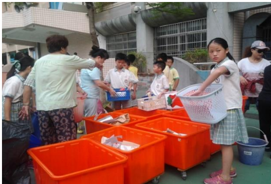
圖1 環保志工-協助資源回收與校園環境